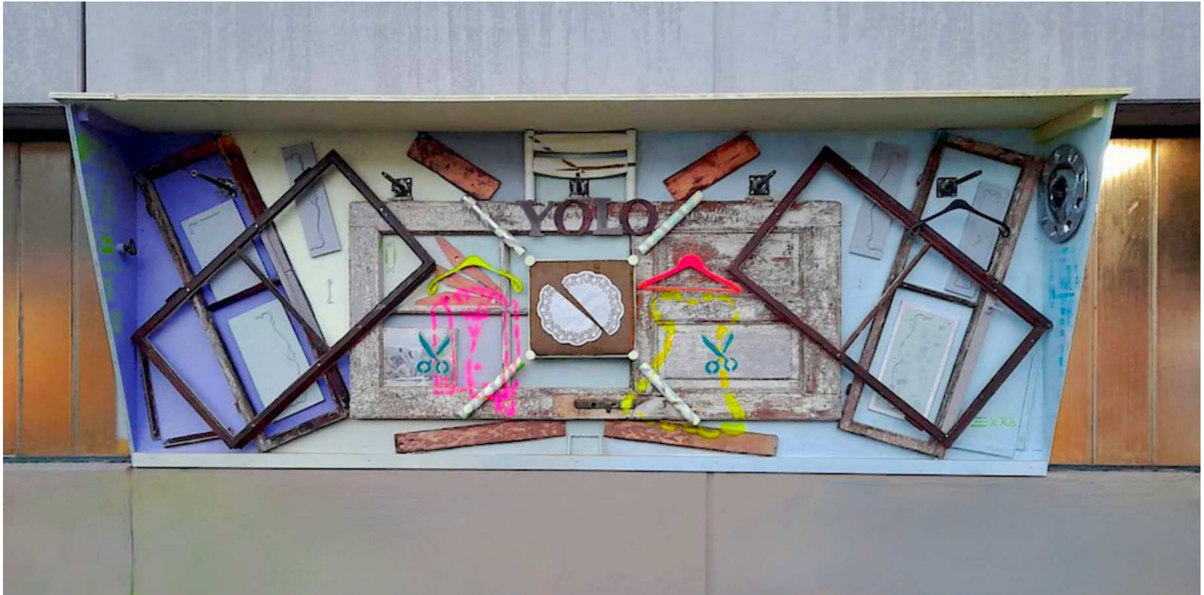
Wall Of Kindness, Innsbruck, 2023