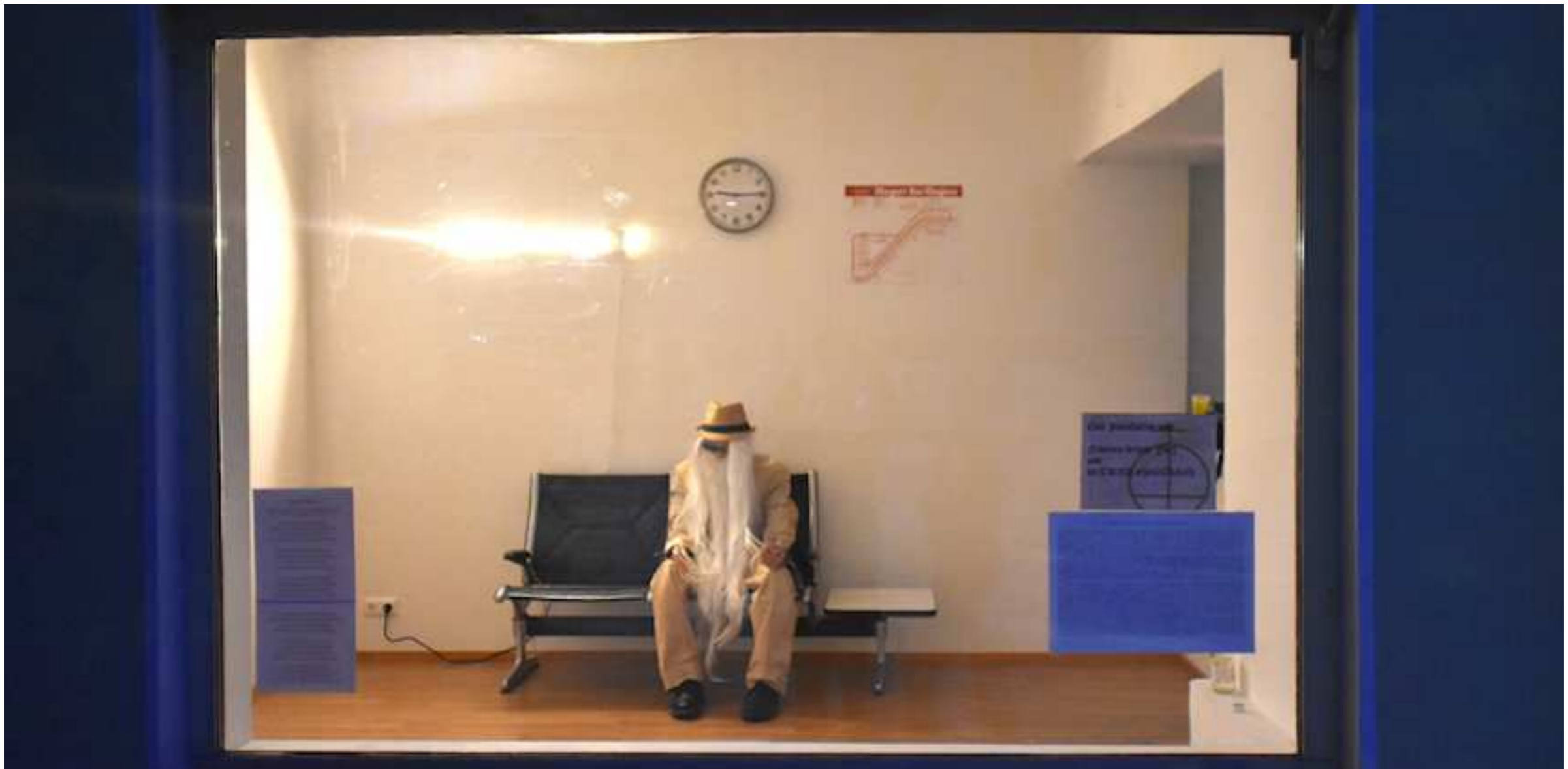
„Nur die Zarten sind fähig zu warten!“ – Installation im ehemaligen Kiosk der Hungeburgbahn, Innsbruck