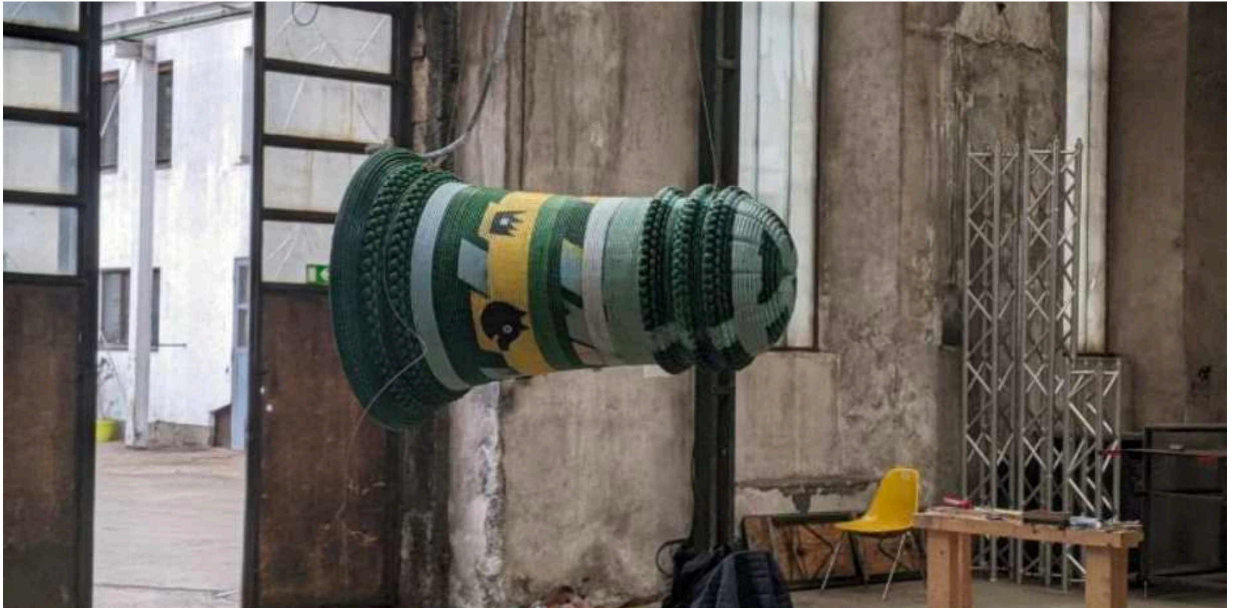
St.Bartlmä, Innsbruck, 2024