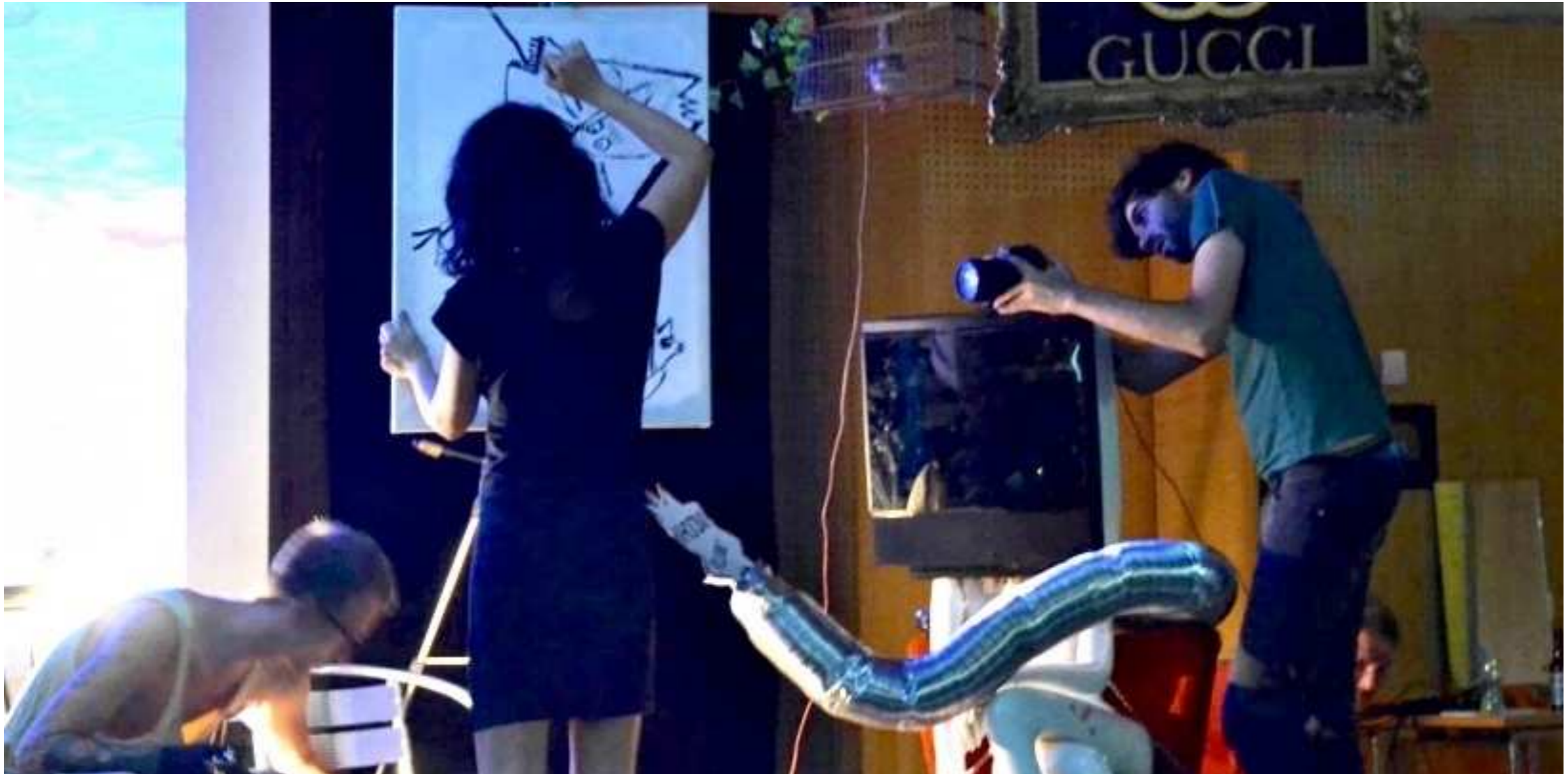
Multimedialer Dialog Vol.I, Haus der Begegnung, Innsbruck, 2018