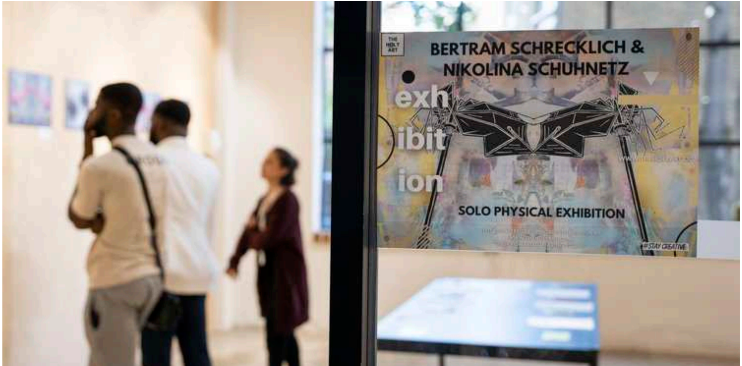
Holy Gallery, London, 2022