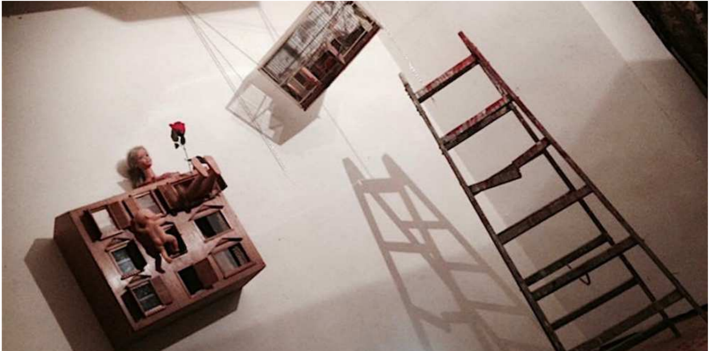
harmony rules, where nothing else matters, Gallery Solution, Prag, 2016