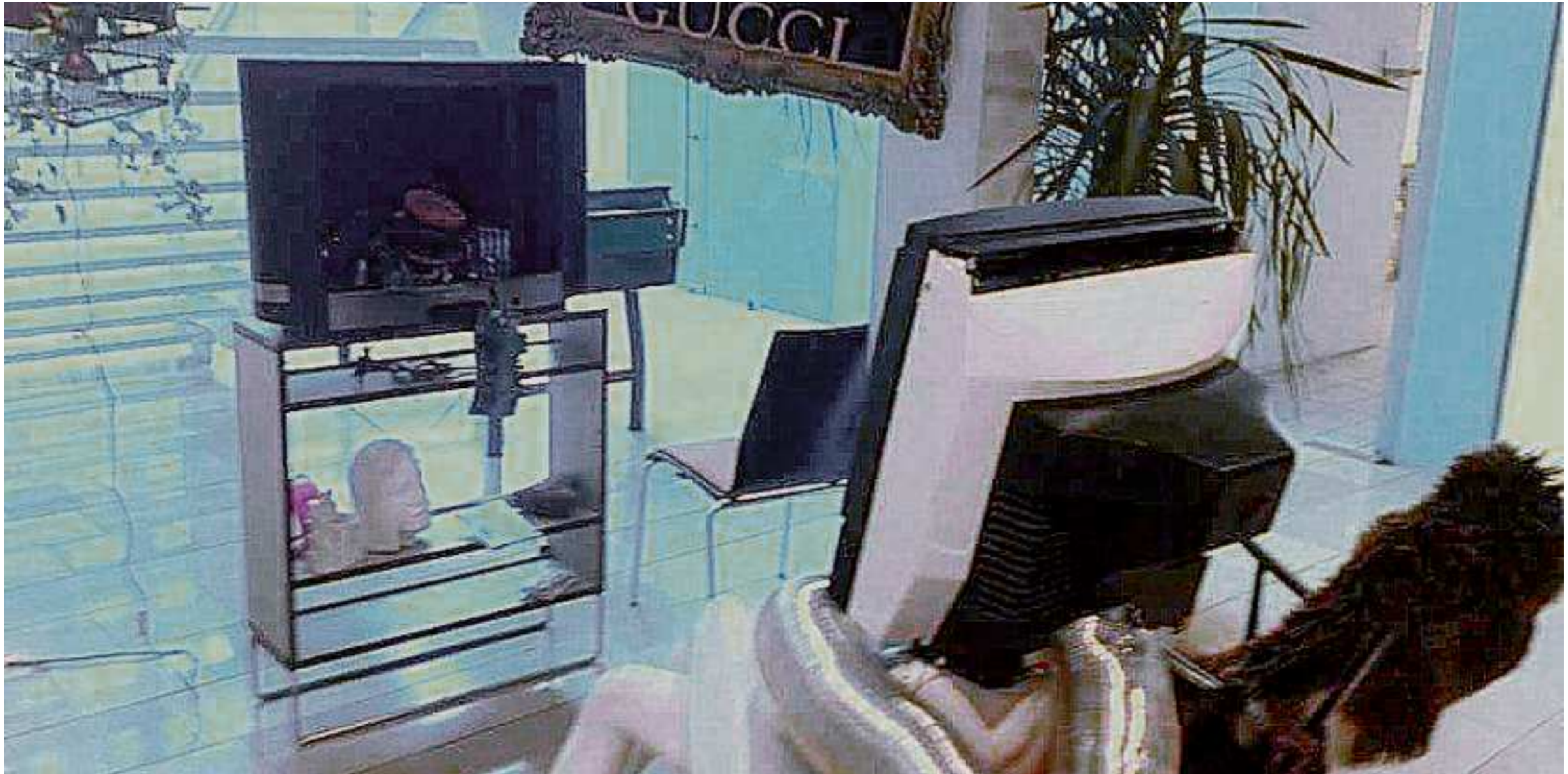
Artefakte des Scheiterns, Haus der Begegnung, Innsbruck, 2018